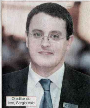
O editor do livro, Sérgio Vale