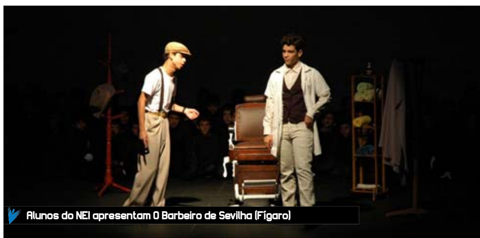
Alunos do NEI apresentam O Barbeiro de Sevilha (Fígaro)

Na ocasião, também foram divulgados os vencedores do 1º Fes-